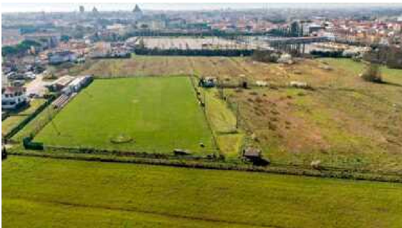
L'area dove dovrebbe sorgere il centro sportivo nerazzurro