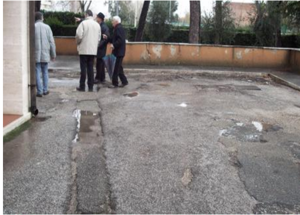
Foto 2 Manto stradale dissestato in inverno