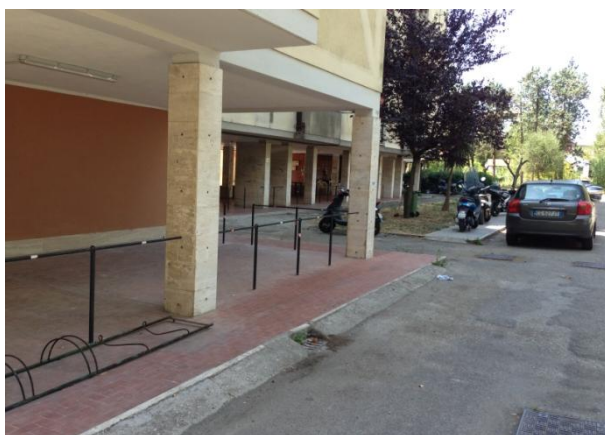
Foto 6 ringhiere realizzate da A.P.E.S.