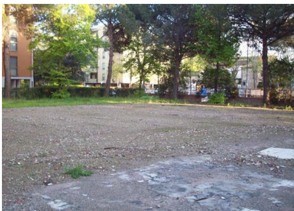
Foto 5 sedime dell'ex asilo Timpanaro abbandonato