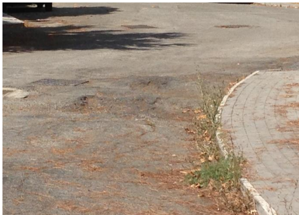
Foto 3 Manto stradale dissestato in estate