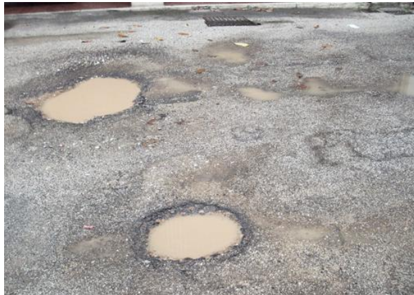
Foto 1 Manto stradale dissestato in inverno